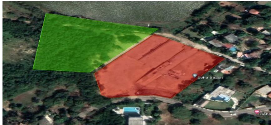
Ilustración 1. Área aprovechada polígono rojo, área compensada polígono verde

“POR MEDIO DE LA CUAL SE DA POR CUMPLIDAS LAS OBLIGACIONES IMPUESTAS MEDIANTE LA RESOLUCION No. 623 DE 2015, A LA EMPRESA RICASOLI S.A.S., IDENTIFICADA CON NIT 900.400.407-5, UBICADA EN EL MUNICIPIO DE TUBARA- ATLANTICO Y SE DICTAN OTRAS DISPOSICIONES”